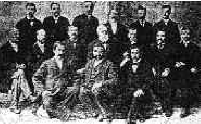
Merzifonda Amerikan missioner məktəbi tələbələri

onlar İslama qarşı ən böyük düşmənçilik etmiş olarlar. Peyğəmbərimiz Minada oxuduğu xütbədə buyurmuşdur ki: "Sizin qanınız, malınız digərinizə haramdır. Onu bilin ki, siz Qiyamətdə Allahın hüzurunda bir araya gələcək, etdiklərinizə görə sorğu-suala çəkiləcəksiniz. Etdiyiniz əməllərin qarşılığını alacaqsınız. Zinhar, məndən sonra o kafirlər kimi firqələr (=qruplaşmalar, dəstələr - A.Y.) yaradıb, biri-birinizə qənim kəsiləsiniz." Mövcud olan dinlərin kitabları hamısı ortadadır. Oxuyun onları, sonra bir kərə də "Qurani-Kərim"i mütaliə edin, bunları tədqiq etsəniz, aradakı fərqi görərsiniz. Dinimiz mövcud dinlərin ən möcüzəlisidir (=sadə olduğu qədər də mükəmməlidir). Kitabımız - kitabların sonuncusu və nöqsansızdır. Dinimizi bəyənməyənlər - bu dindən nəsibini almayanlar və ondan xəbərsizlərdir. Bu fikrə qarşı etiraz etmək üçün onlar "Quran"ın ən azı qısa məzmununu (=məalını, izahını, yorumunu - A.Y.) bilməlidirlər. "Quran"ın mənasını heç kim anlaya bilməz" və ya "Quran" tərcümə oluna