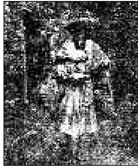
řeyx Nasır pařa