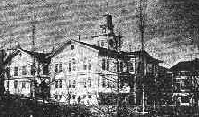
Merzifonda Amerikan missioner məktəbi

təqdim etdiklərindən və əsər yazmadıqlarından, onların adlarına heç yerdə rastlamadım. Bu gün 150 missioner cəmiyyətinin yaxud şirkətinin, on min missionerin və əlli min köməkçinin fəaliyyətdə olduğu bilinir.