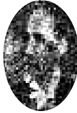
Sosioloq Çarlz Buş